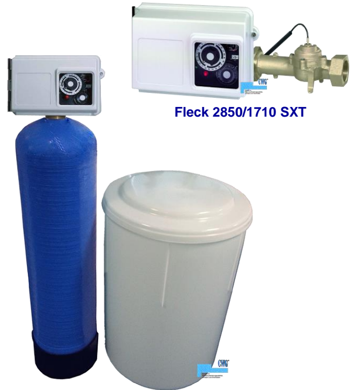
Fleck 2850/1710 SXT