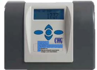
CLACK WS 1" CK