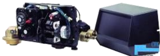
FLECK 9000/1600 SXT 1"